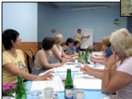
Foto z některých vzdělávacích modulů projektu