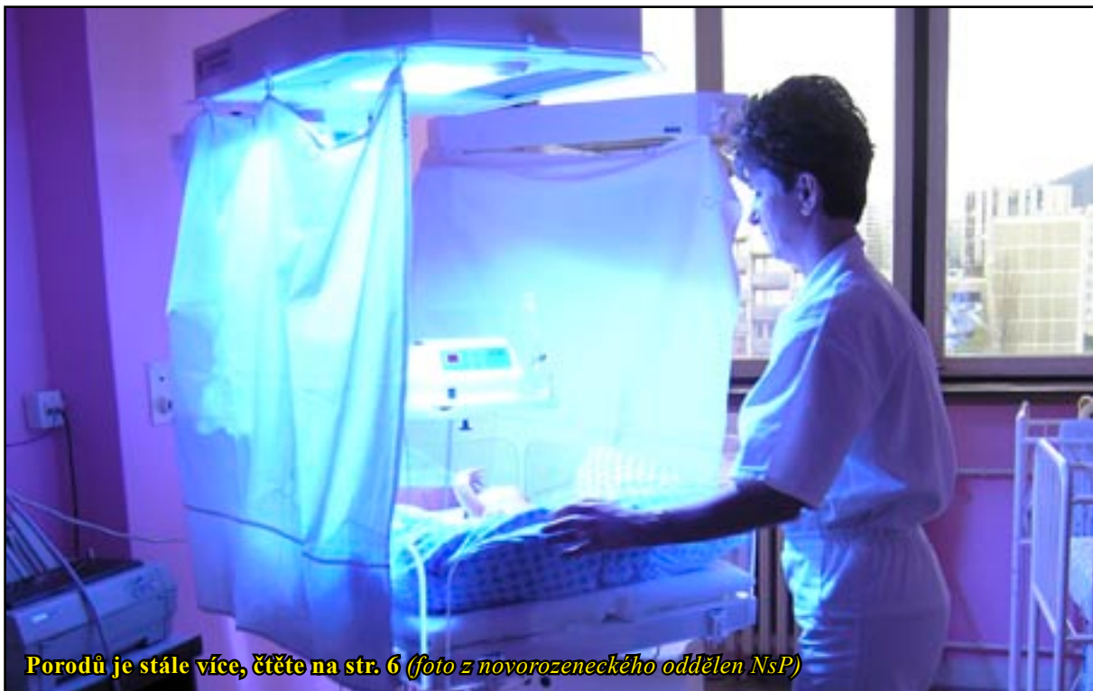
Porodů je stále více, čtěte na str. 6 (foto z novorozeneckého oddělení NsP)